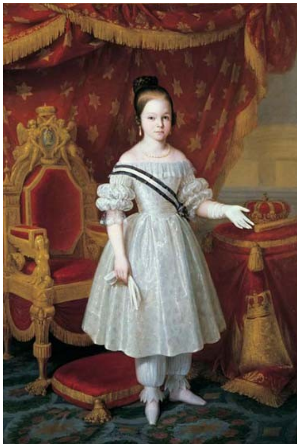
La reina Isabel II cuando era niña.

Siendo anciano el Rey y no teniendo otra descendencia que su hija Isabel, de corta edad, promulgó un decreto que derogaba la ley Sállica y nombraba heredera a su hija. También establecía que hasta la mayoría de edad de la niña, ocuparía el trono su madre, la Regente María Cristina.