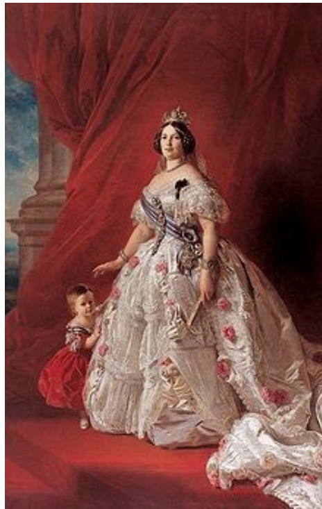
La reina Isabel II de adulta en 1852 con su hija