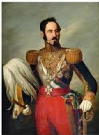
El general isabelino Espartero

A pesar que la guerra estaba perdida, el general carlista Cabrera apodado "El Tigre del Maestrazgo" prosiguió la lucha durante varios meses más. Una de las plazas carlistas que se mantuvo fiel a Cabrera fue Bejís fuertemente fortificada.