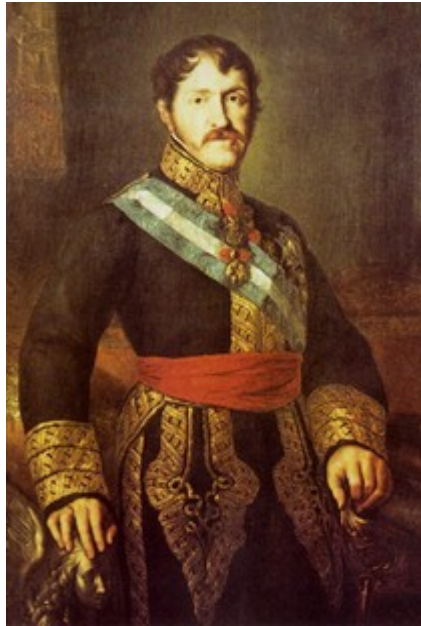
El infante Carlos

No obstante el Infante Carlos María Isidro, hermano de Fernando, no aceptó esta decisión y, creyéndose con mejores derechos para ocupar el trono que su sobrina Isabel, se exilió a Portugal para poder contactar con sus adeptos y preparar la lucha armada.