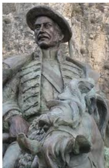
El general carlista Cabrera

Para su conquista fue designado el general isabelino Francisco Javier Azpiroz y Jalón que se presentó el 7 de Mayo de 1840 en Torás con un fuerte contingente de tropas dotadas de artillería que se instalaron para el asedio a Bejís.